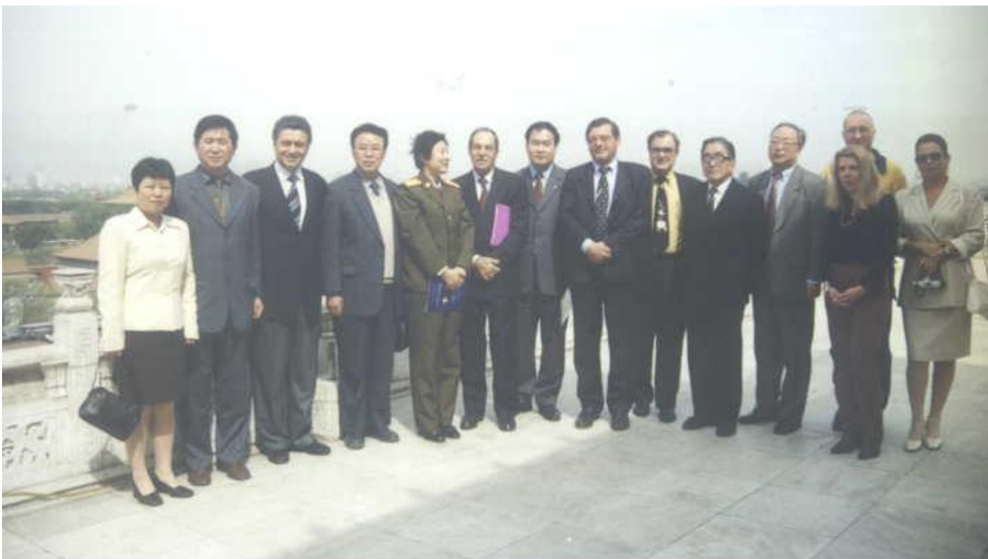
Foto2. foto di gruppo degli oratori e accompagnatori